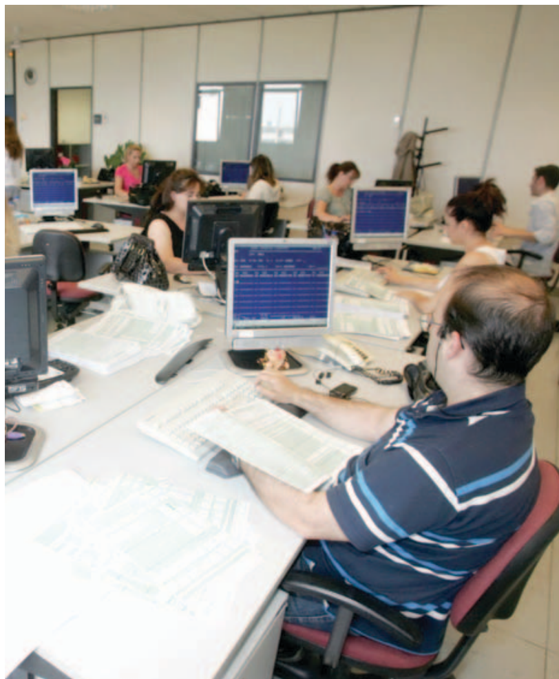
Το δίκαιο ανταγωνισμού μπορεί να αποτελέσει ισχυρό εργαλείο προστασίας του Έλληνα φορολογουμένου, περιορίζοντας το κόστος των κρατικών προμηθειών.

Παρά το γεγονός ότι η Επιτροπή Ανταγωνισμού δίνει συγκεκριμένες κατευθύνσεις με τον οδηγό για την ανίχνευση και πρόληψη συμπαιγνιακών πρακτικών σε διαγωνισμούς προμηθειών, αρκετά σημεία παραμένουν θολά.